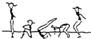
Rolamento à retaguarda (10%)