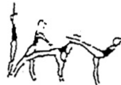
Posição de equilíbrio (avião, bandeira, etc.) (5%)