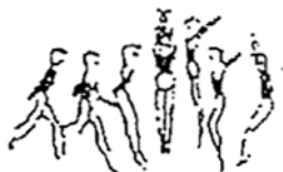
Corrida e salto em extensão com 1/2 volta (5%)