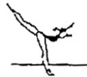
Posição de equilíbrio (5%)