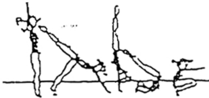
Apoio facial invertido, rolamento à frente (20%)

Construa uma sequência, com as diversas figuras, de forma a obter no mínimo 60% de média do valor global dos elementos técnicos.