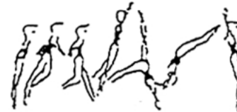
Salto de mãos à frente (10%)